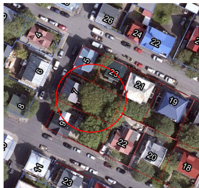
Loftmynd af Stýrimannastíg 7