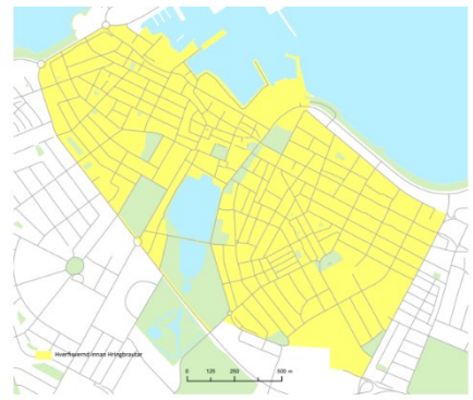
Svæðið er með hverfisverndarákvæði