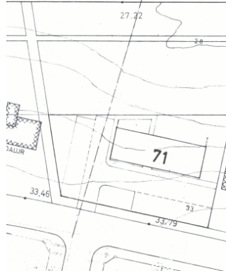
Götumynd, tekin af Já.is.