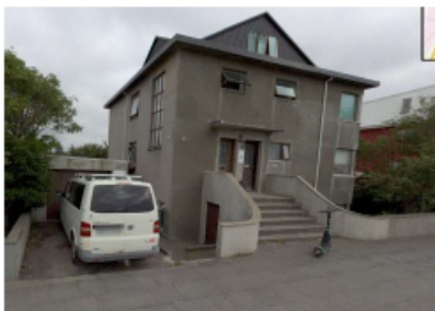
Götumynd, séð frá Snorrabraut