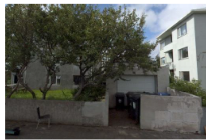
Götumynd tekin af já.is, séð frá Auðarstræti