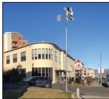
Staðsetning á listaverki