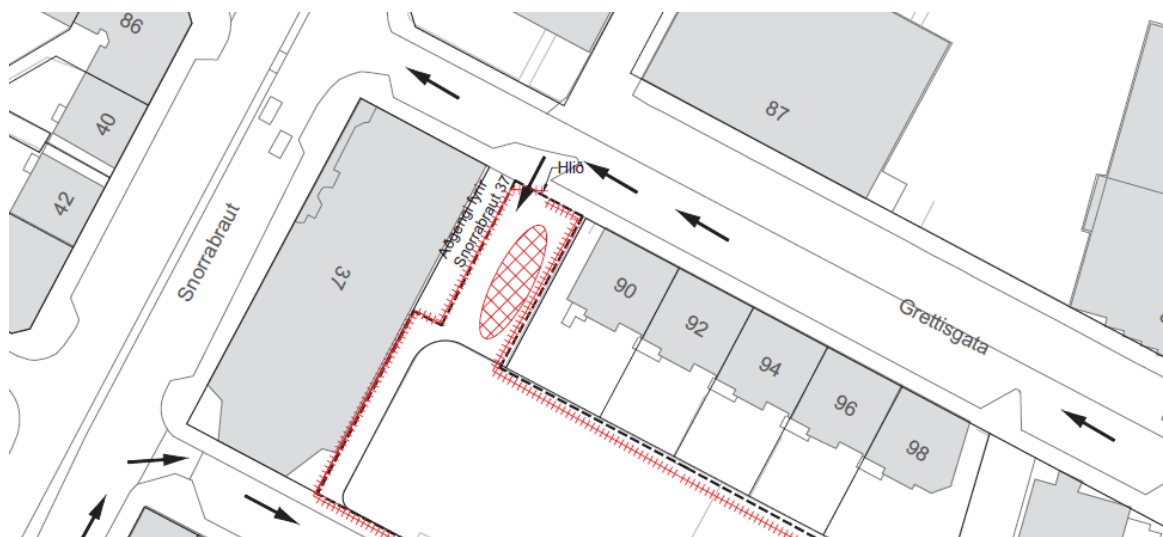
Yfirlitsmynd sem sýnir mörk framkvæmdasvæðis, öryggisgirðingu, akstursleið og aðstöðu verktaka. Þar sést einnig að aðkoma að Snorrabraut 37 er tryggð.

Meðan á framkvæmdatímanum stendur verður hluti svæðisins notaður fyrir aðkomu framkvæmdasvæðis. Aðgengi að inngöngum og sorplátum verður þó áfram tryggt sbr. eftirfarandi skýringamynd.