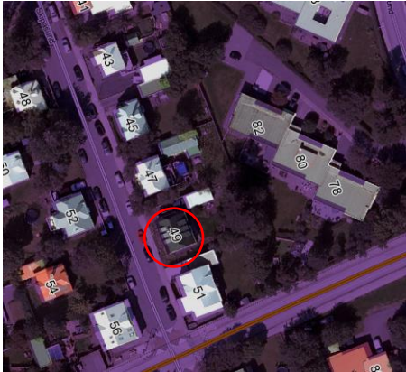
Aðalskipulag Reykjavíkur 2040

Á embættisafgreiðslufundi skipulagsfulltrúa 2. mars 2023 var lögð fram fyrirspurn Guðmundar K. Guðmundssonar, dags. 30. janúar 2023, um að rífa skúr á lóð nr. 49 við Skipasund og byggja nýjan og stærri á sama stað.