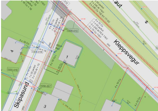
Skjáskot úr Luksjá

Engar aðveitu-eða fráveitulagnir liggja um lóðarræmuna meðfram Kleppsvegi skv. Luksjá. Því er ekkert sem mælir á móti breytingum á lóðamörkum, til samræmis við lóðirnar í kring.