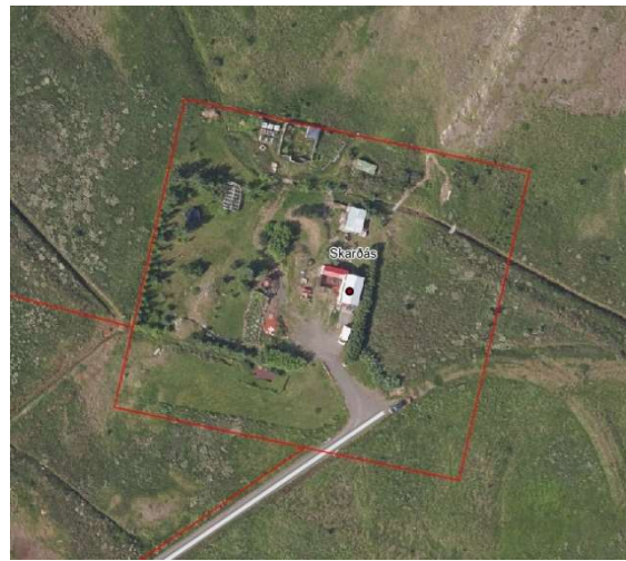
Loftmynd af svæðinu