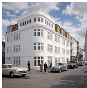
Fjarmynd af tillögu í fyrirspurn