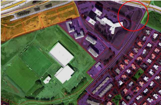
Aðalskipulag Reykjavíkur 2040

Á embættisafgreiðslufundi skipulagsfulltrúa 12. október 2023 var lögð fram fyrirspurn Íþróttafélags Reykjavíkur, dags. 2. október 2023, um staðsetningu og sýnileika auglýsingaskiltis við Breiðholsbraut. Einnig er lagt fram samkomulag Reykjavíkurborgar, umhverfis- og skipulagssviðs, og Íþróttafélags Reykjavíkur, dags. 2. maí 2016.