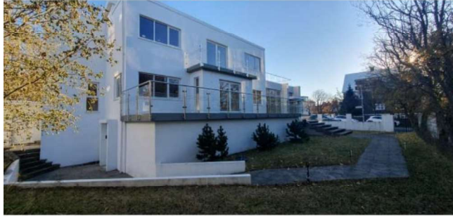
Suðurhlíð - ljósmynd október 2024

Mynd sem sýnir núverandi ástand, fylgdi byggingarleyfissókn.