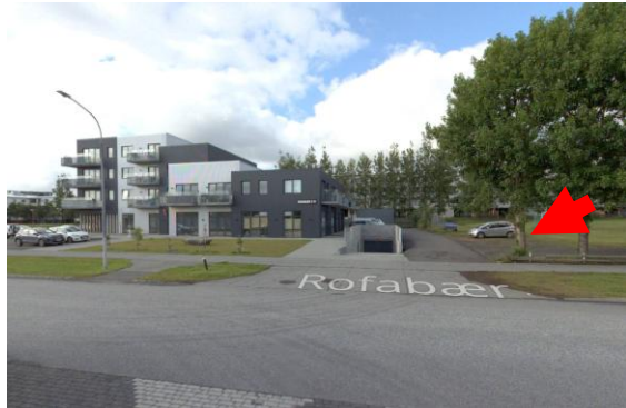
Séð yfir byggingu á Rofabæ 7-9 og svæðið á aðliggjandi lóð þar sem óskað er eftir að útbúa bílastæði.