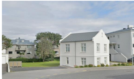
Séð á gamla húsið og lóðina að Reynimel 66