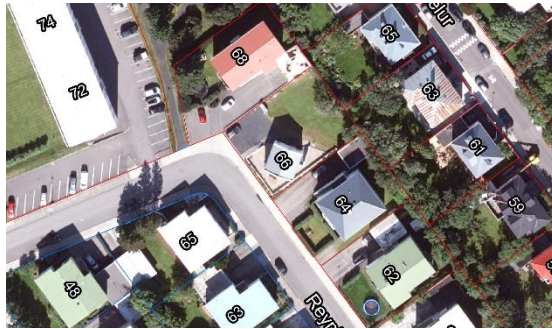
Loftmynd og kort af Reynimel 66 og nágrenni

Á embættisafgreiðslufundi skipulagsfulltrúa dags. 13. mars lögð fram fyrirspurn Sveins Sigurðar Kjartanssonar, dags. 17. janúar 2025, um breytingu á skipulagi íbúða í nýbyggingu á lóð nr. 66 við Reynimel.