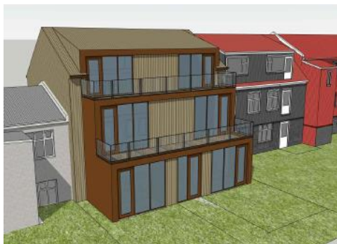
Tillaga 3D / stækkun á byggingareit