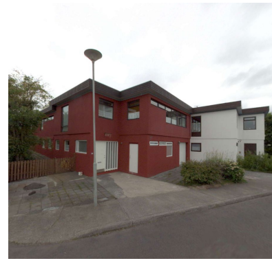
sjáskot, ja.is 2022.