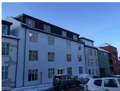
Fram og bakhlið framkvæmd

Á umliðnum árum hefur verið fjallað um nokkuð mörg erindi er varða leyfisveitingar m.a. óleyfisframkvæmdir á lóðunum og gerðar margar umsagnir, vísað er til þeirra er forsöguna varðar. Einnig hefur verið fundað með eigendum m.a. nýverið þar sem fulltrúar eigenda og Reykjavíkurborgar hittust og ræddu mögulega á að finna lausn á málinu og stöður þess.