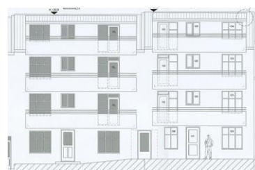
Fram og bakhlið samþykktir aðaluppdrættir samþ 2017