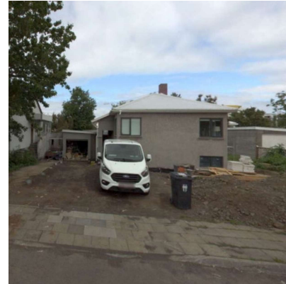
Miðtún 11, skjáskot ja.is 2022.