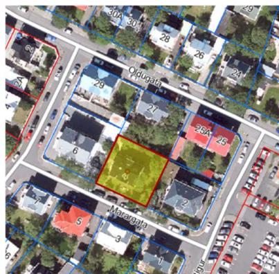
Loftmynd. Ja.is, 2022.