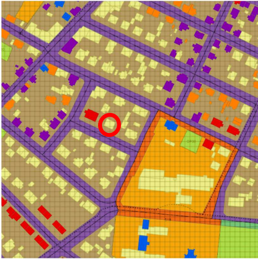
Hluti húsverndarkorts Aðalskipulags Reykjavíkur 2040 – Sólvallagata 47 merkt rauðum hring.

Húsið er byggt árið 1929 og samkvæmt aldursákvæði 29. gr. laga um menningarminjar nr. 80/2012, sem segir: „Eigendum húsa sem byggð voru 1940 eða fyrr sem hyggjast breyta þeim, flytja þau eða rífa er skylt að leita álits Minjastofnunar Íslands.“