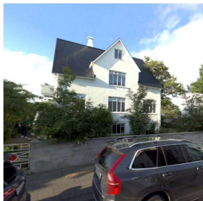
Skjáskot af Marargötu 4.