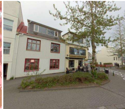
Götumynd af ja.is (tekin í júní 2023)