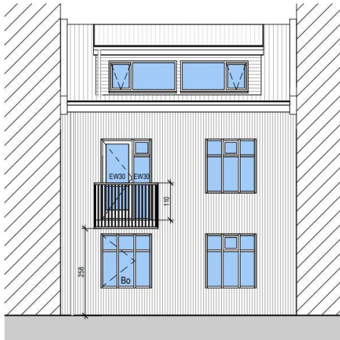
Götuhið að Njarðargötu.

Óskað er eftir afstöðu skipulagsfulltrúa á leyfi fyrir gististað í flokki II án veitinga með gistingu fyrir allt að 4 manns í íbúð 0201, ásamt því að setja 1 metra djúpar svalir Njarðargötumegin auk áður gerðra innanhússbreytinga í húsi nr. 28a við Lokastíg.