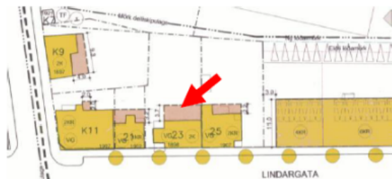
Lindargata 23 á deiliskipulagsupprætti.