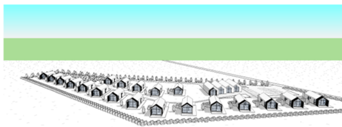
Séð frá Vestri