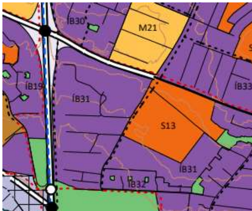
Úr Aðalskipulagi Reykjavíkur 2040