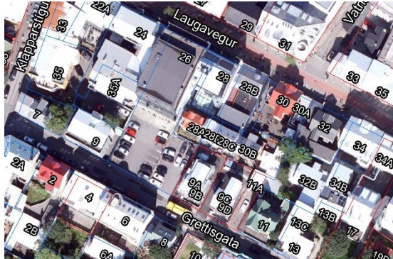
Loftmynd og kort af Laugavegi 28D og nágrenni

Á embættisafgreiðslufundi skipulagsfulltrúa 6. febrúar 2025 var lögð fram fyrirspurn Dómus ehf., dags. 21. janúar 2025, ásamt greinargerð, ódags. um breytingu á skráningu íbúðar með fasteignanúmerið F2004817 í húsinu á lóð nr. 28D við Laugaveg úr ósamþykkt íbúð í samþykkt íbúð.