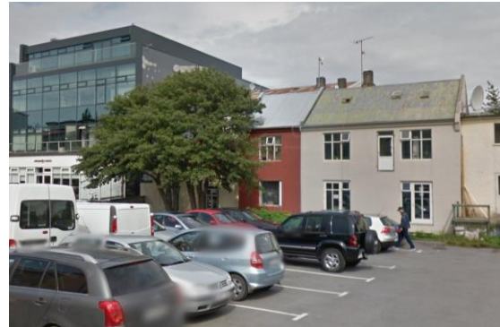
Mynd af húsinu á Laugavegi 28D, fyrir breytingar, séð frá Grettisgötu.