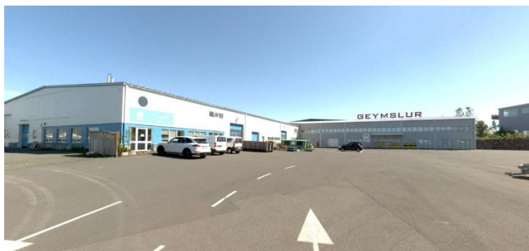
Aðalskipulag Reykjavíkur 2040 Götumynd

Aðalskipulag: Í gildi er Aðalskipulag Reykjavíkur 2040, samþykkt í borgarstjórn Reykjavíkur 19. október 2021 og birt í B-deild stjórnartíðinda 18. janúar 2022. Samkvæmt aðalskipulagi tilheyrir lóðin að Tunguhálsi 8 borgarhluta 7 Árbær og er á skilgreindu athafnasvæði AT2.