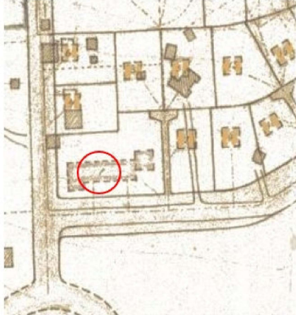
Deiliskipulag í gildi