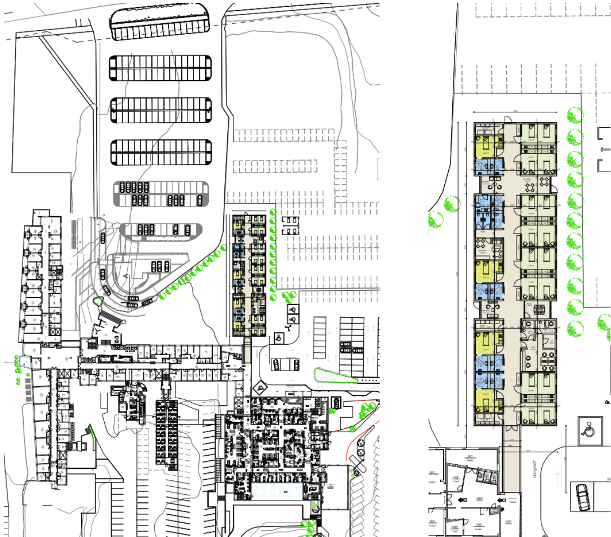
Skýringauppráttur sýnir tillögu á 20 rúma matsdeild norð-vestan við núverandi bráðamóttöku - Grunnmynd

Mikil aukning hefur orðið á álagi á alla starfsemi spítalans með hækkandi aldri og fjölsfjölgun þjóðarinnar. Núverandi húsnæði er löngu sprungið og fullnægir vart lengur nútíma kröfum um húsnæði sjúkrahúsa. Mjög þröngt er um sjúklinga og starfsfólk og má fullyrða að ástandið með vaxandi komuálagi sé orðið óbærilegt þar sem sjúklingar þurfa að liggja á göngum spítalans og í rýmum sem ekki voru hugsuð fyrir klíniska starfsemi. Nýr Landspítali ohf. (NLSH) vinnur að byggingu nýrrar bráðamóttöku við Hringbraut en það húsnæði verður ekki tekið í notkun fyrr en á árunum 2028-2029.