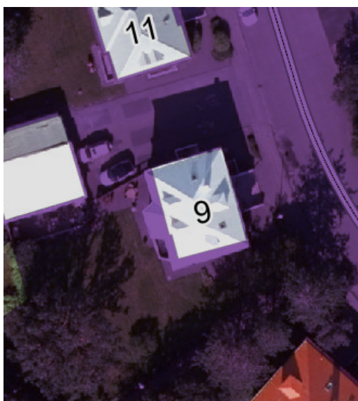
Aðalskipulag Reykjavíkur 2040 Deiliskipulag

Á embættisafgreiðslufundi skipulagsfulltrúa 23. janúar 2025 var lögð fram fyrirspurn Arkís arkitekta ehf., dags. 20. desember 2024, ásamt bréfi, dags. 19. desember 2024, um að breyta tveimur kvistum á suðurhlíð hússins á lóð nr. 9 við Kvisthaga í einn stærri kvist ásamt því að bæta við svölum framan við kvistinn.