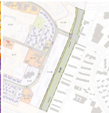
Hluti gildandi hverfisskipulags