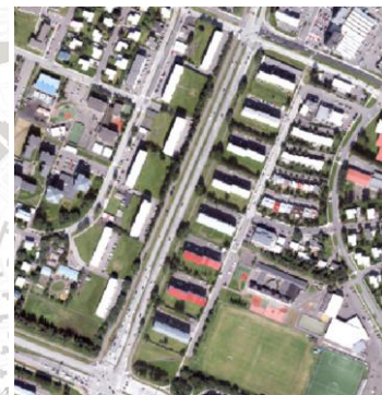
Loftmynd dags. 20/07/2022.