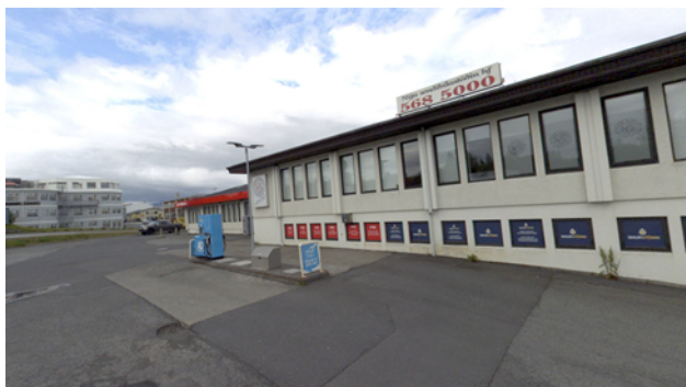
Götumynd tekin á já.is