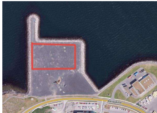
Afmökun athafnasvæðis Faxaflóahafna skv. erindi