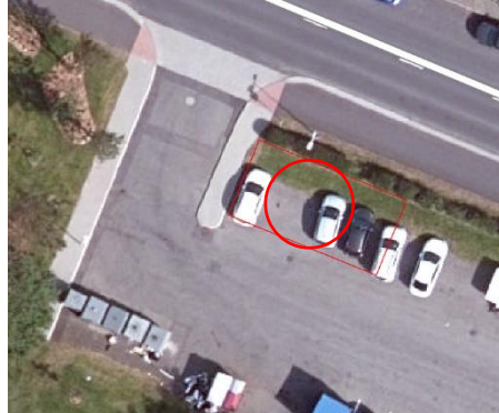
Loftmynd af lóðinni