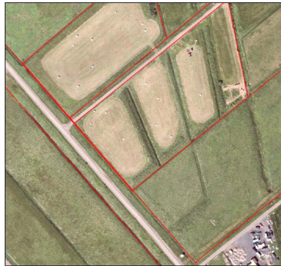
Loftmynd af svæðinu.