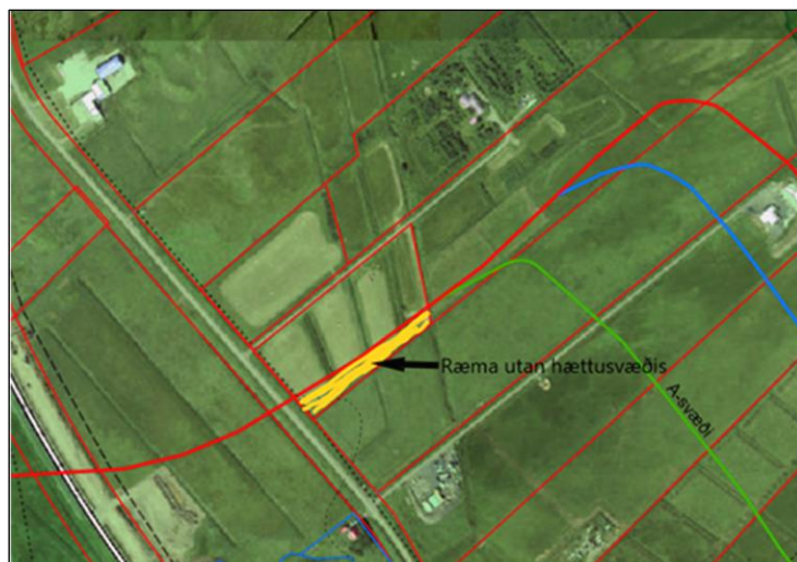
Gulleit ræma utan hættusvæði.

Hins vegar nær hluti Stóragils út fyrir skilgreind hættusvæði til suðausturs og er þar um að ræða um 3.300 m 2 ræmu.