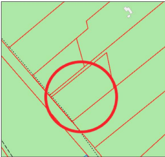
Landnotkun skv. aðalskipulagi Reykjavíkur 2040.

Lögð fram fyrirspurn Björns Rósenkranz Björnssonar, dags. 17. september 2024, um að færa byggingarreit í landi Stóragils á Kjalarnesi þannig að hann verði utan hættusvæðis ofanflóðamats og 10 metrum frá lóðamörkum, samkvæmt uppd. Punktur og hnit, dags. 17. september 2024.