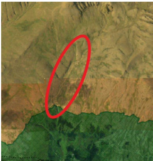
Hluti aðalskipulags Reykjavíkur 2040.

Lögð fram umsókn Skógræktarfélags Reykjavíkur, dags. 19. júní 2024, um framkvæmdaleyfi vegna lagfæringar á brú og gönguleið í Esjuhlíðum. Einnig er lögð fram greinargerð Skógræktarfélags Reykjavíkur og Eflu vegna umsóknar framkvæmdasjóðs ferðamannastaða október 2023.