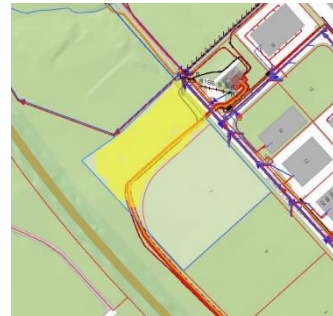
Skýringarmynd með beiðni