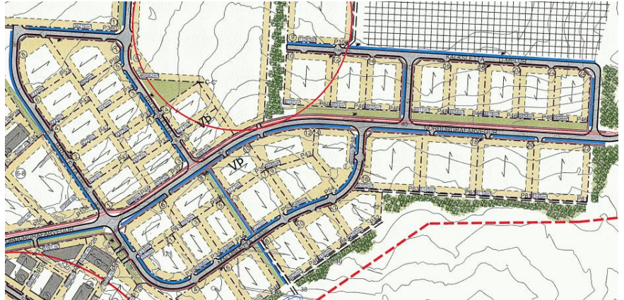
Hluti af deiliskipulagsbreytingu, samþykkt 2. júlí 2020