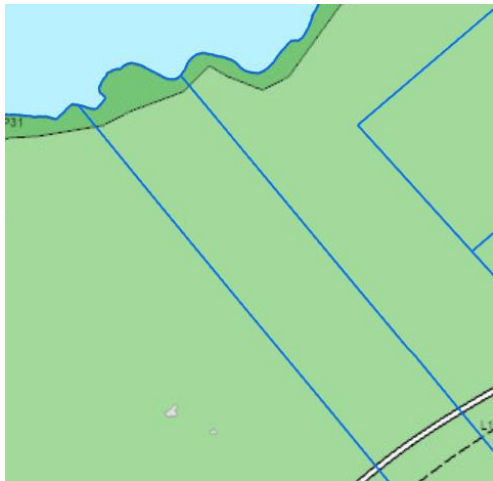
Landnotkun skv. AR 2040.

Lögð fram fyrirspurn Hlés Guðjónssonar, dags. 6. febrúar 2025, um að setja gestahús á lóð merkt L125742 í Norðurkoti á Kjalarnesi, samkvæmt Uppdr. Tensio ódags.