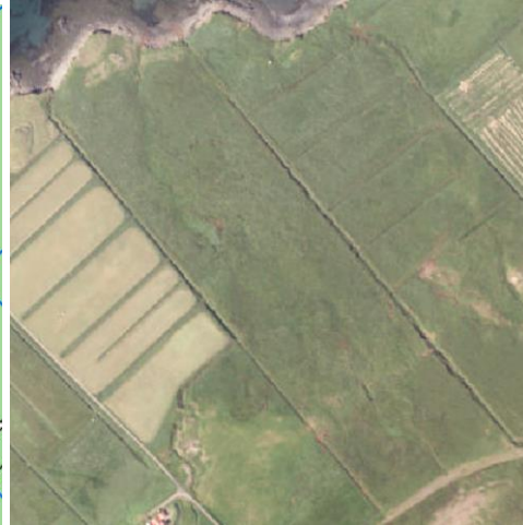
Loftmynd af svæðinu..