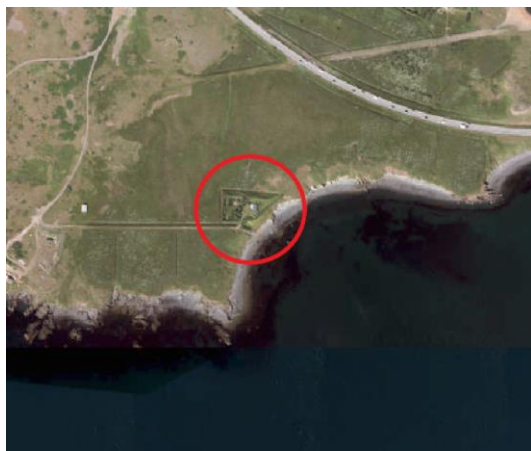
Loftmynd af svæðinu.