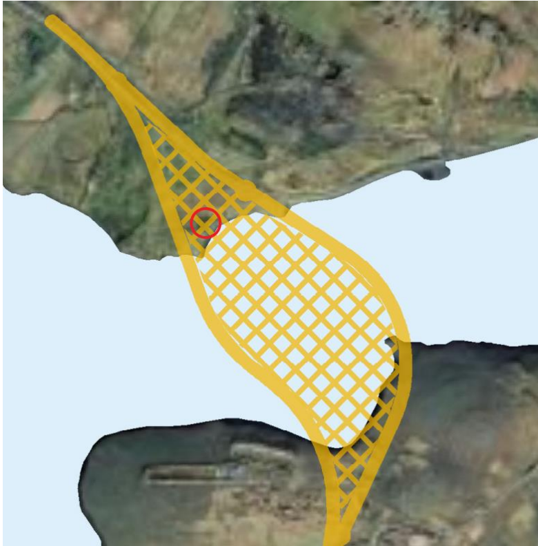
Rannsóknarsvæði sem miðað verður við í umhverfismati (Sundabraut – Matsáætlun).

Eins og sjá má á yfirlitsmyndinni fellur staðsetning þeirrar lóðar (rauður hringur) sem sótt er um að afmarka, innan áður nefnds rannsóknarsvæðis sem miðað verður við í umhverfismati.