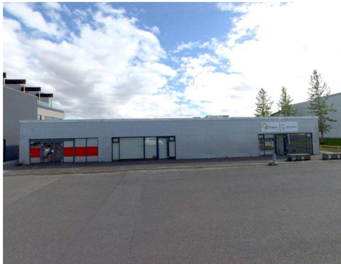
Kirkjustétt 2 (Já 360 – mynd tekin í júní 2022).

hámarkshæð 11,30 m. Verslun og þjónusta skal vera á jarðhæð og heimilt að gera allt að 17 íbúðir á 2. og 3. hæð. 3. hæðin skal vera inndregin um 3 m að austanverðu.“