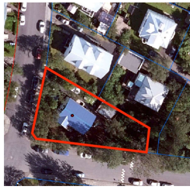
sjáskot, ja.is 2022.