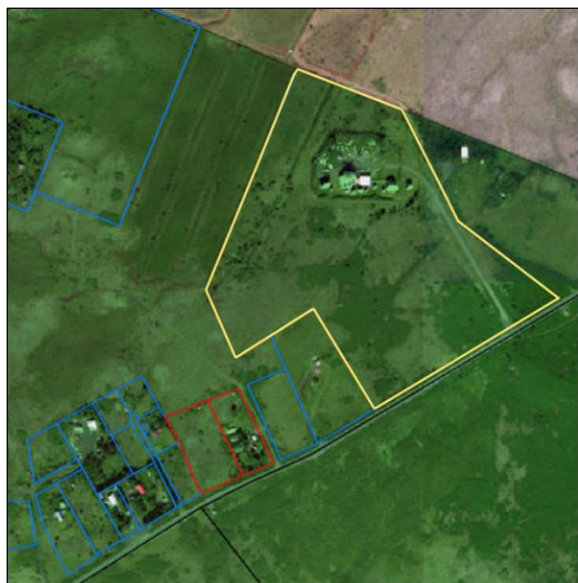
Loftmynd af svæðinu.