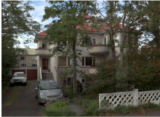
Götumynd, tekin af Já.is.