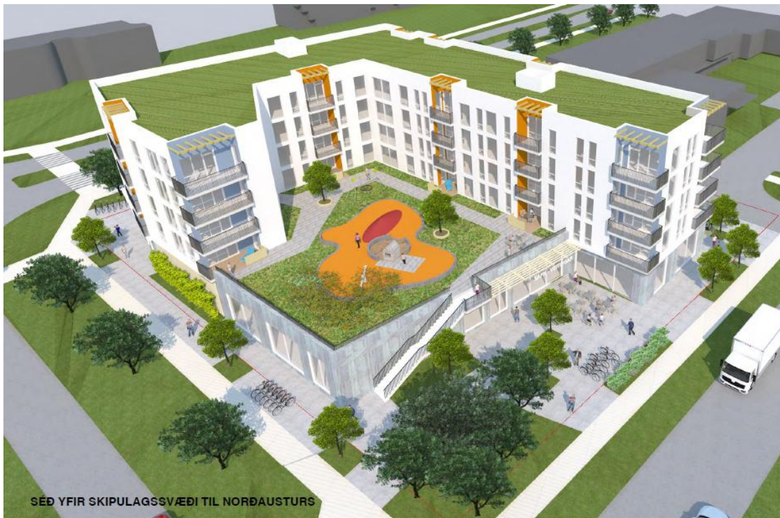
Mynd af skipulagssvæðinu með fyrirspurnaruppdrætti

Fyrirspurn sækist eftir álitni á nokkuð ítarlega unnum gögnum og vísi að deiliskipulagsuppdrætti um stækkun lóðar úr 2.321m 2 í 2.983,3m 2 , heimild fyrir niðurrifi á núverandi húsi á lóð, stækkun aðalbyggingarreits, heimild fyrir 5 hæða byggingu og kjallara undir allri byggingu og töliverðri aukningu á byggingarmagni á lóð. Gert er ráð fyrir atvinnurými á 1. hæð byggingarinnar og íbúðum á 2. til 5. hæð. Þakgarður er yfir 1. hæð þar sem hún er nokkuð stærri en íbúðarhæðirnar og bílakjallari undir allri byggingunni.