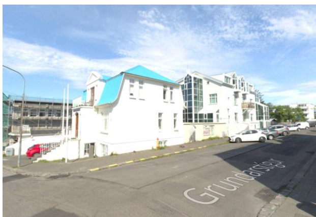
Götumynd tekin á já.is