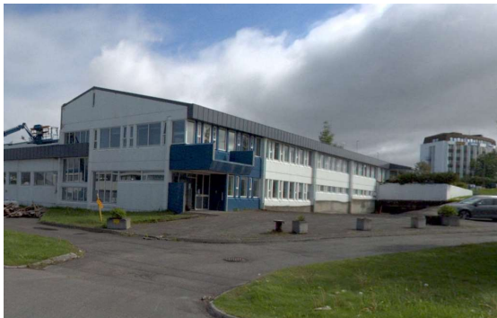
Götumynd (júlí 2022)