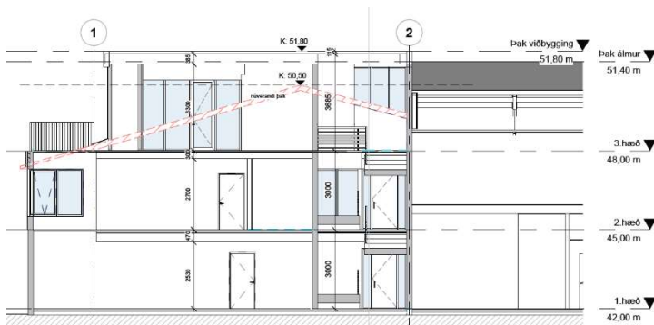
Teikning með fyrirspurn: Núverandi þak sýnt með rauðu

Ekki er gerð skipulagsleg athugasemd við að umsækjandi láti vinna breytingu á deiliskipulaginu sbr. erindið. Bíla- og hjólastæðakrafa á lóðinni skal vera skv. viðmiðum fyrir svæðið í bíla- og hjólastæðastefnu Reykjavíkurborgar. Sýna skal útfærslu á yfirborðinu og leggja áherslu á aðlaðandi umhverfi fyrir gangandi og hjólandi. Skuggavarpmyndir (fyrir og eftir) skulu vera hluti af gögnum.