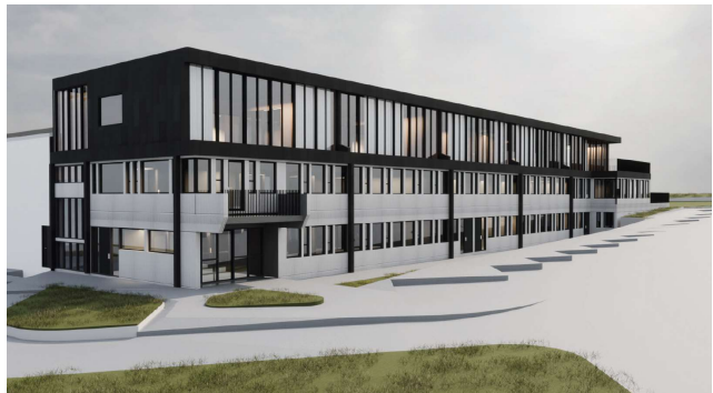
Þrívíddarmynd með fyrirspurn