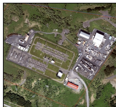
Lofmynd af svæðinu