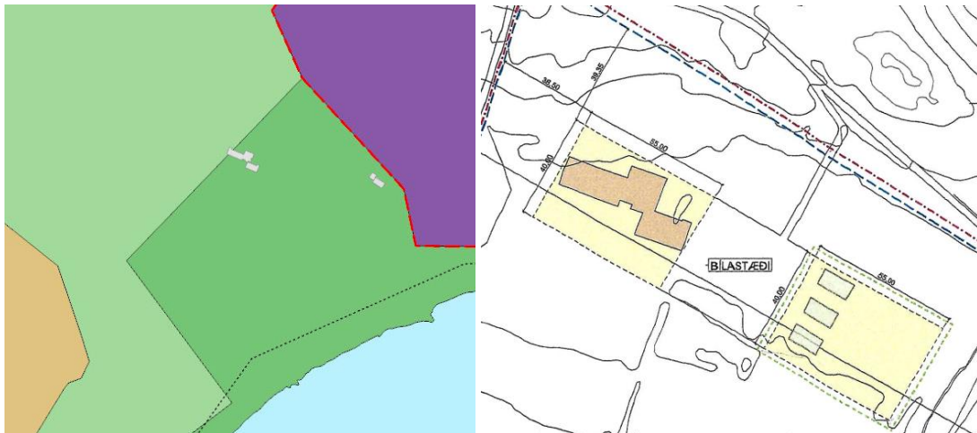
Landnotkun skv. aðalskipulagi Reykjavíkur 2040. Hluti gildandi deiliskipulags.

Lagt fram erindi frá afgreiðslufundi byggingarfulltrúa frá 12. desember 2023 þar sem sótt er um leyfi til þess að byggja, úr þremur samsettum gámaeiningum, sem byggt er yfir og klætt utan með timbur- eða áklæðningu, hús, mhl.02, með geymslu, vinnustofu og líkamsrækt fyrir íbúa búsetukjarna á lóðinni Hólaland, Kjalarnesi.