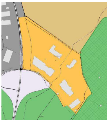
Hluti AR 2040

Lögð fram fyrirspurn Snælands ehf., dags. 13. júní 2024, ásamt bréfi Zeppelin arkitekta, dags. 13. júní 2024, um breytingu á deiliskipulagi Hádegismóa vegna lóðarinnar nr. 6 við Hádegismóa sem felst í breytingu á lóðarmörkum, samkvæmt uppdr. Zeppelin arkitekta, dags. 13. maí 2024. Einnig er lögð fram yfirlitsmynd og ljósmyndir.