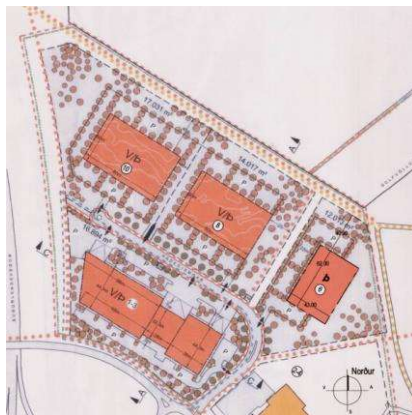
Hluti gildandi deiliskipulags