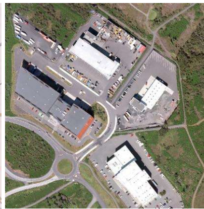
Loftmynd, dags. 20.7.2022.