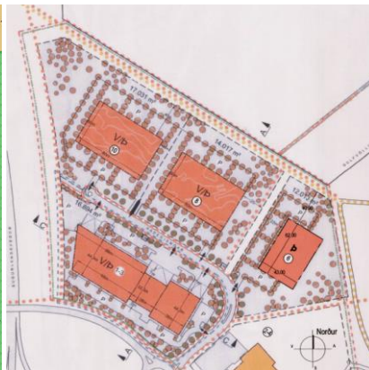
Hluti gildandi deiliskipulags