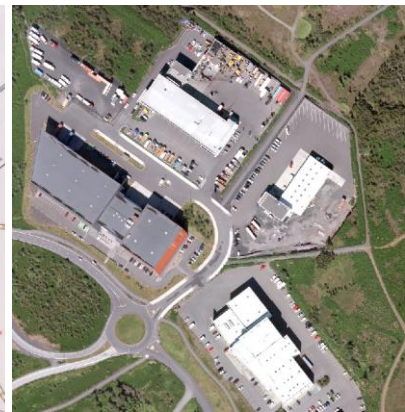
Loftmynd, dags. 20.7.2022.