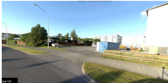
Mynd af núverandi innkeyrslu