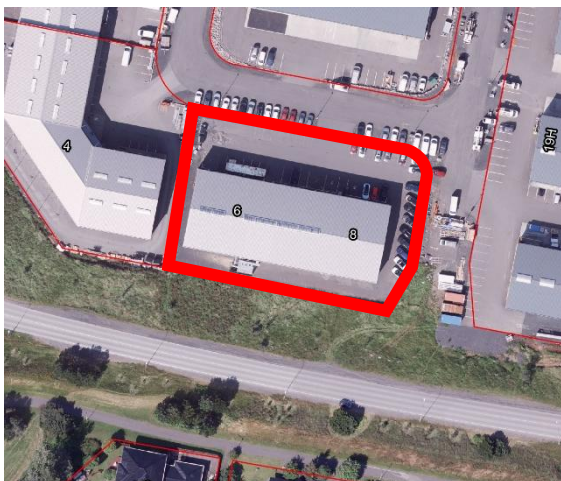
Loftmynd og kort af Gylfaflöt 6-8 og nágrenni

Lögð fram fyrirspurn Vikingblendz ehf., dags. 17. apríl 2026, um rekstur rakarastofu á 2. hæð hússins á lóð nr. 6-8 við Gylfaflöt, án aðgengis fyrir einstaklinga sem nota hjólastól.