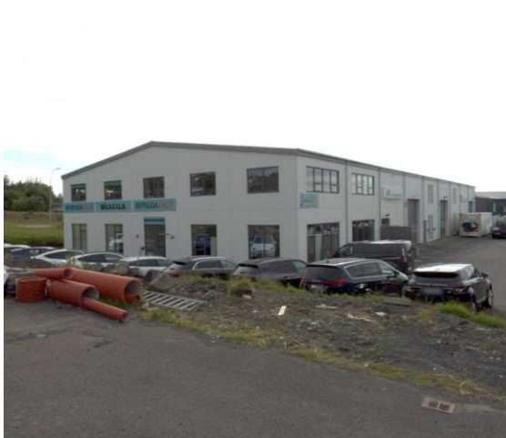
Byggingin á Gylfaflöt 6-8